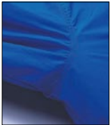
袖付けは、腕を上げた時の引き つりが少ない3Dスリーブ仕様