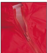
フロントジップは、ビスロン ファスナー仕様