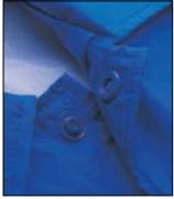
フロントスナップボタンは YKK製プラスチック仕様