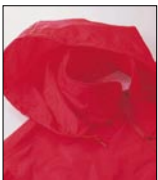
スタンド襟部分はフードイン